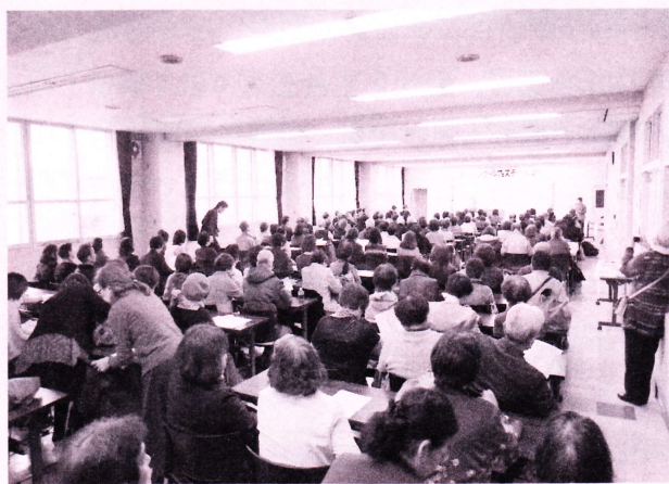
171名の満席のなか開会式でスタート

* ～編集後記～ ～ ～ ～ ～ ～ ～ ～ ～ ～ ～ ～ ～ ～ ～ ～ *