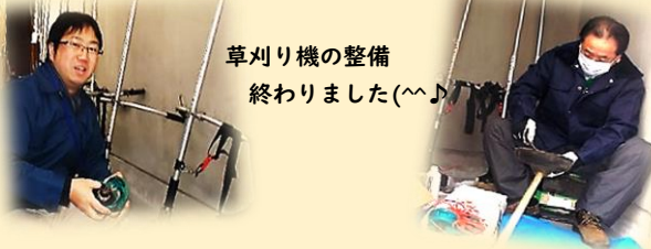
草刈り機の整備 終わりました(^^)