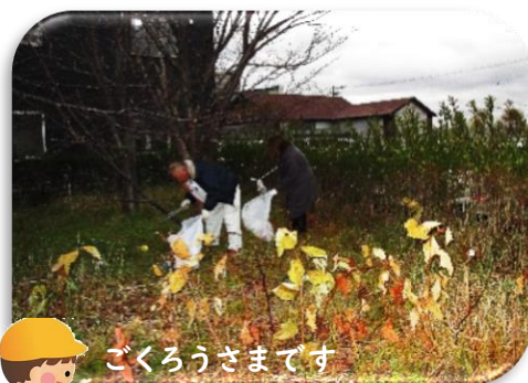
ごくろうさまです

先日、海岸町 3 丁目公園と緑地帯の空き缶や散乱ごみの清掃活動を行いました。海岸町 3 丁目公園は、過去にゲートボール等でにぎわってました。また、今も変わらず春から初夏には桜をはじめ、いろいろな花が豪華絢爛に咲き誇り、この公園に訪れる人々の憩いの場であり、地域の皆さまが大事に育てている公園です。