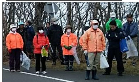
青山市長のあいさつで清掃活動スタート!