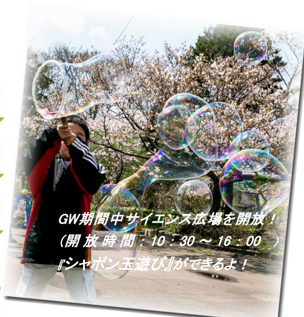
GW期間中サイエンス広場を開放! (開放時間:10:30~16:00) 『シャボン玉遊び』ができるよ!