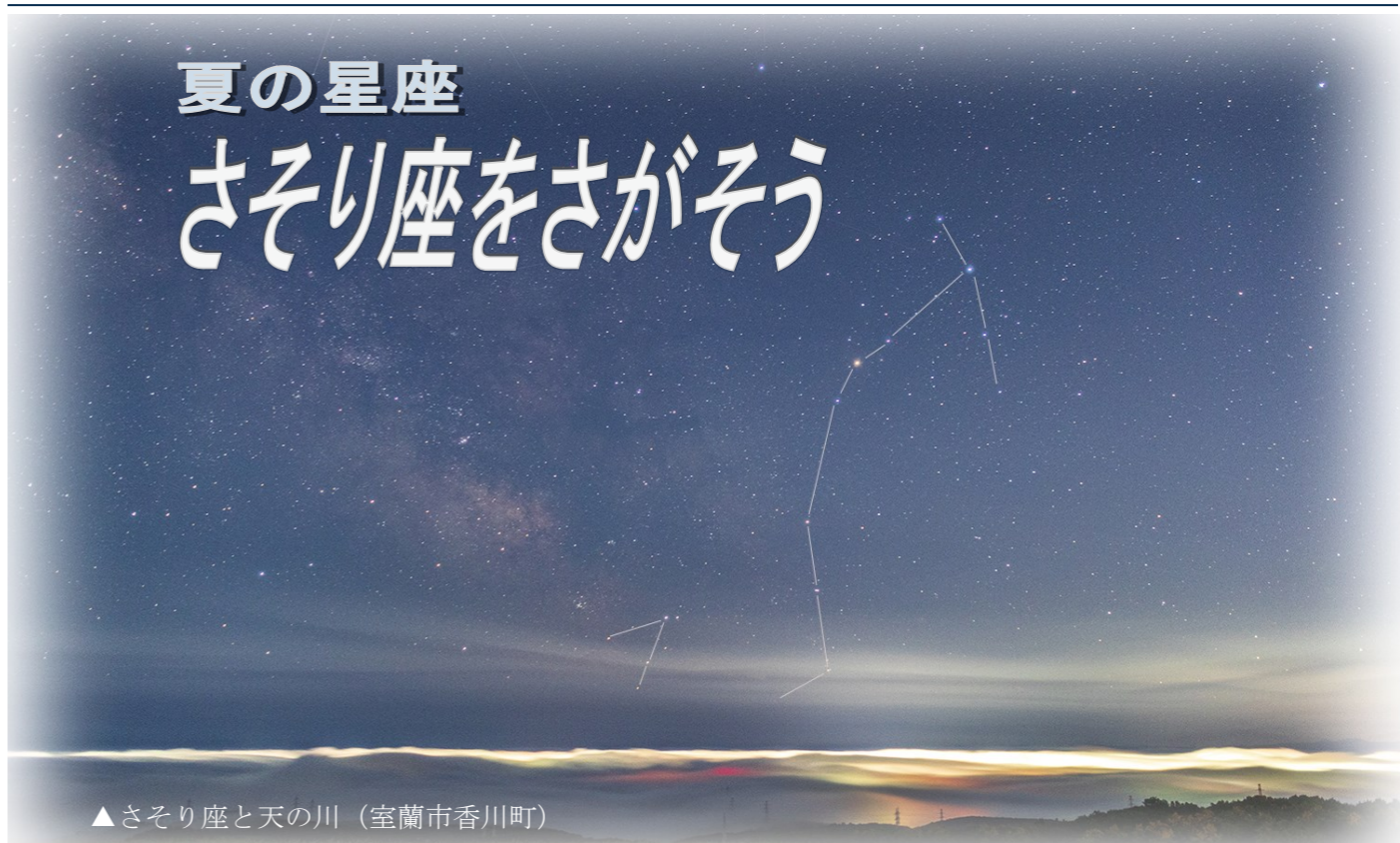
▲さそり座と天の川 (室蘭市香川町)