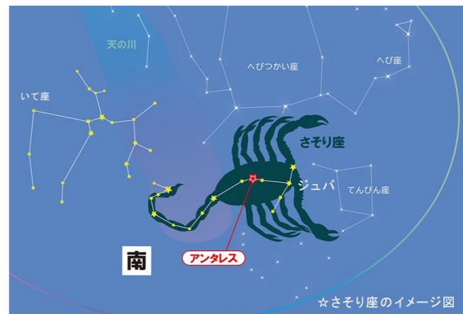
☆さそり座のイメージ図