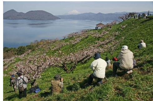
恒例の撮影行 春の壮瞥公園にて

私たちは小さなグループではありますが、まだまだ続けていきたいですね。私と同じく80代のメンバーもいますが、精力的にいろいろな場所に出かけカメラを向けて魅力的な写真を撮り続けています。これからも美しい光景や感動との出会いを求めながら、写真の面白さやカメラを持つ楽しさを伝えていきたいですし、共感しあえる会でありたいと思っています。カメラもフィルムからデジタル、そして今ではスマホに主流が変わりつつありますが、自身が得た感動を写真を通じて他の人に伝える面白さを追求し、活動の輪を広げていきたいと思いますので、興味のある方は気軽にお声かけください。